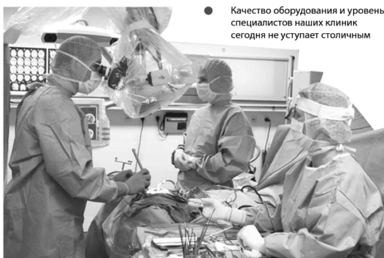
● Качество оборудования и уровень специалистов наших клиник сегодня не уступает столичным

Что касается местных медицинских чудес, то знаете ли вы, что сейчас при тяжелых переломах у нас проводят операции малотравматичного штифтования – разрез всего лишь 1 см, и уже через 2 недели прооперирован-